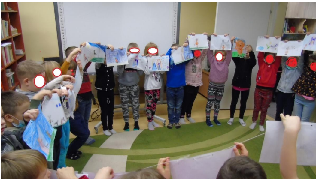
Fotografia 4. Lekcja biblioteczna. Ze zbiorów własnych Powiatowej Biblioteki Pedagogicznej w Giżycku. CC-BY

Po prezentacji nauczyciel bibliotekarz wyraża podziw dla pięknych prac. Następnie prosi by każde dziecko kliknęło ikonkę emocji adekwatną do jego samopoczucia. Kończąc połączenie on-line dziękuje dzieciom i nauczycielowi za aktywność i żegna się.