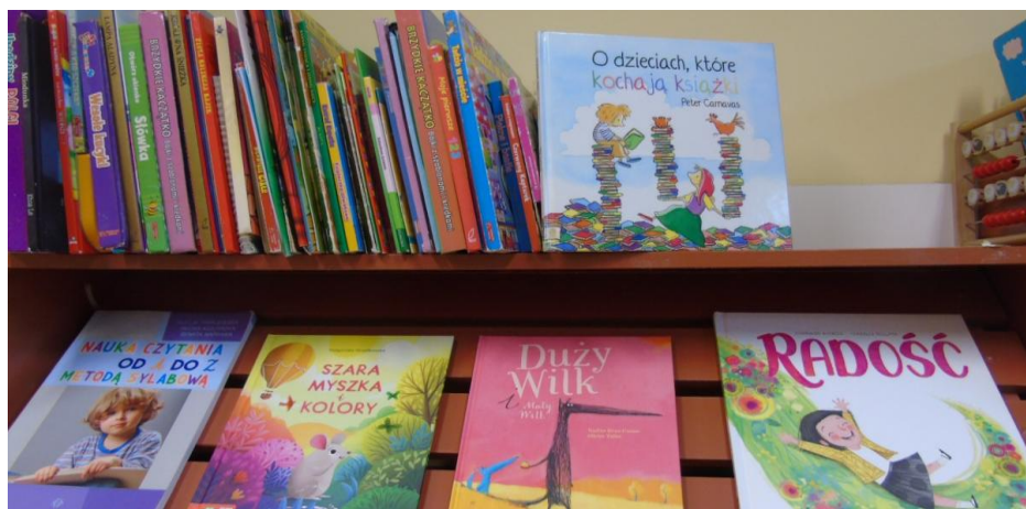
Fotografia1. Półka z książkami. Ze zbiorów własnych Powiatowej Biblioteki Pedagogicznej w Giżycku. CC-BY

Informuje dzieci, że jest to film animowany co oznacza, że nie ma kwestii mówionych tylko obrazy i muzyka.