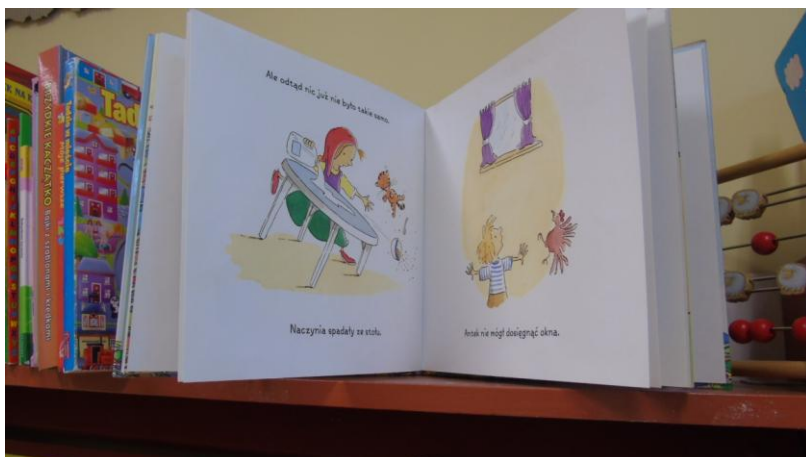
Fotografia 2. Półka z książkami.